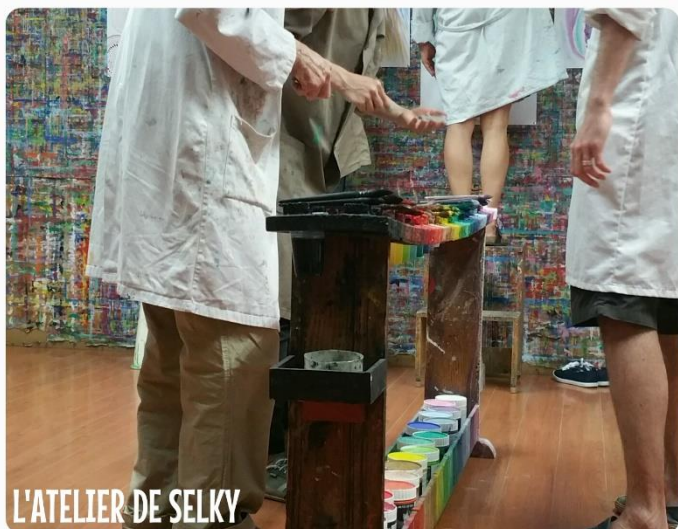
L'ATELIER DE SELKY

Leur scrupuleuse conservation fait partie de mon rôle de Servante.