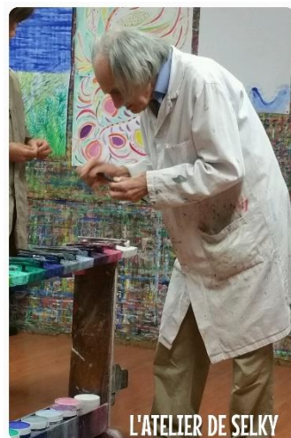
L'ATELIER DE SELKY